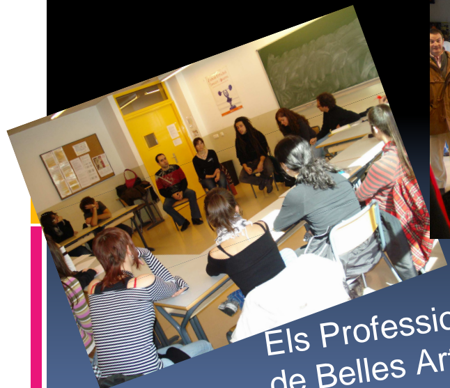
Els Professionals de Belles Arts