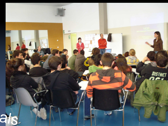
Els Professionals d'Educació Física