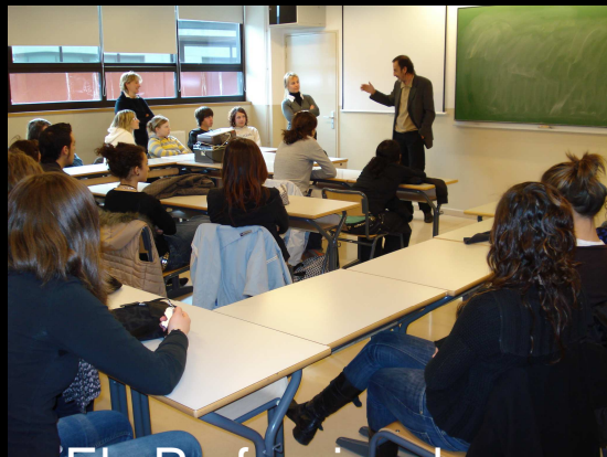
Els Professionals de la Psicologia